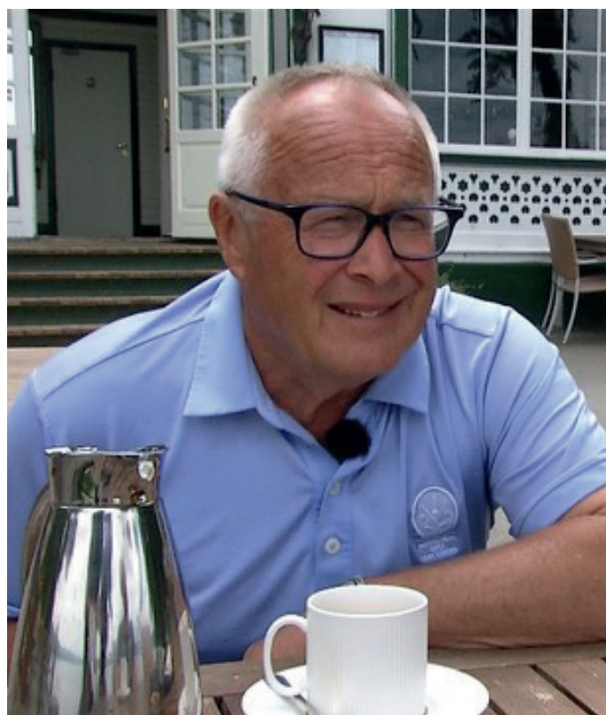
Kurt Leth gæster foreningen den 7. december kl. 19.30.