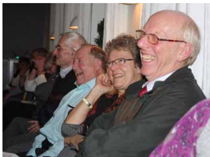
Villemoes' foredrag fremkaldte stor latter i Græse gl. skole