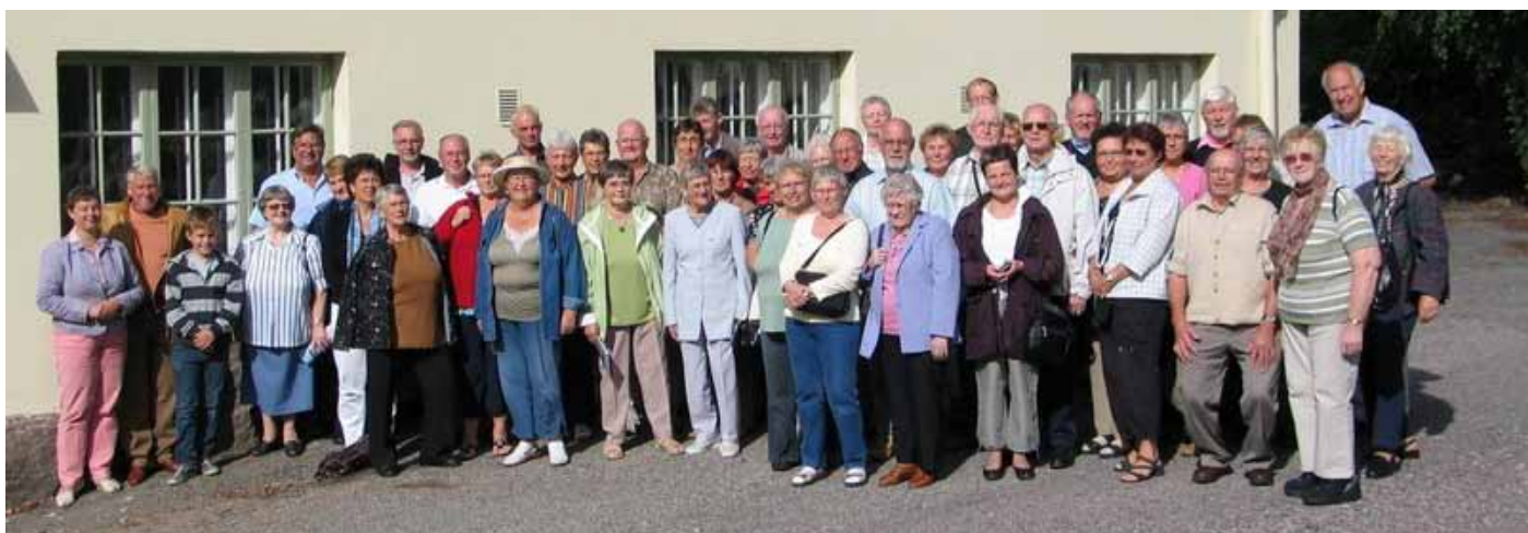
Oplevelsesrig sensommertur 2007 til Helsinki for 47 medlemmer

I september 2007 stævner 47 medlemmer ud på en 4-dages sensommertur til Stockholm og Helsinki. Det blev en god og oplevelsesrig tur med et dejligt fællesskab under hele turen.