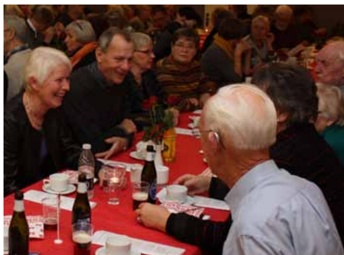
Det sociale samvær har gode vilkår i Græse gl. skole – altid ved veldækkede borde

melse med medlemmerne udtalte påskønnelse af visse kategorier. Det er således ingen hemmelighed, at f.eks. æblekager, tærter, lagkager og kager med fyld i øvrigt er et "hit" blandt medlemmerne.