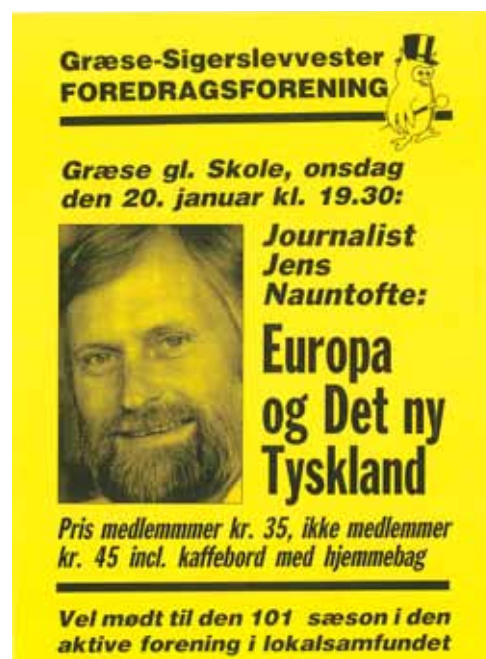
Fantastisk foredragsaften med stor spørgelyst