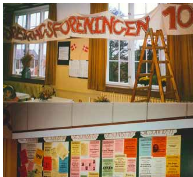
Udstilling i den gl. skolestue, november 1991

Ved en enkelt lejlighed har Foredragsforeningen holdt et arrangement i Elværket i Frederikssund, idet bestyrelsen ønskede at skabe mere synlighed om foreningens eksistens, ligesom der var forventning om stor interesse til foredragsarrangementet med skuespiller Helle Virkner i november 1994. Det blev en